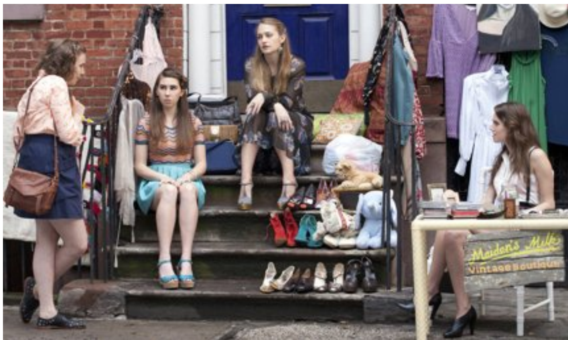
Hannah (Lena Dunham, l.), Shoshanna, Jessa en Marnie: vier meisjes op zoek naar ervaringen in New York.